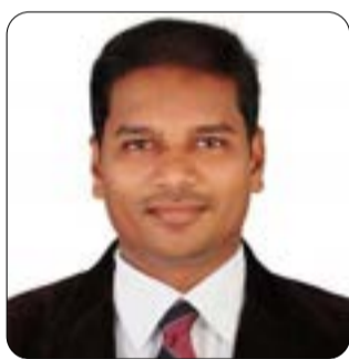
വി പ്രസാദ് ആന്ദ്രാപ്രദേശ്

ക്രിസ്തു അനുമാനിച്ച മാനവികത പൂർണ്ണമായിരുന്നു; മനുഷ്യനായിരിക്കുക എന്നതിന്റെ അർത്ഥമെല്ലാം അവൻ സ്വയം ഏറ്റെടുത്തു - ശരീരം, ആത്മാവ്, മനസ്സ്, ഇച്ഛ - പാപം ഒഴികെ. പുതിയ നിയമത്തിലെ ഇണിപ്പറയുന്ന പരിഗണനകളിൽ നിന്ന് യേശുവിന്റെ മനുഷ്യത്വം വ്യക്തമാണ്. അവൻ ജനി